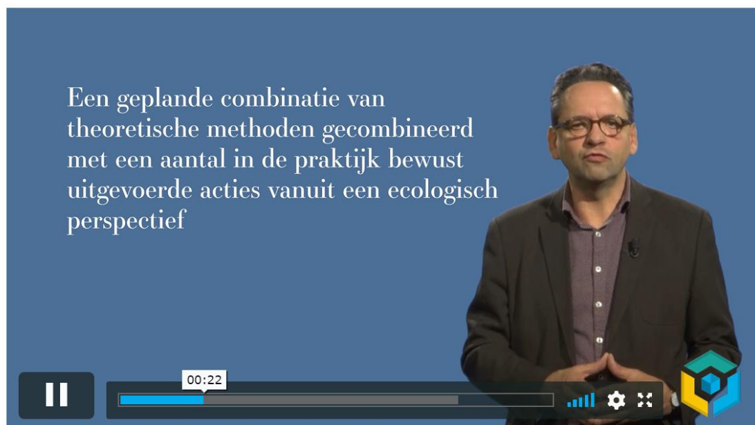
Figuur 3. Impressie kennisclip bij module 'cliëntvraag in het vizier'