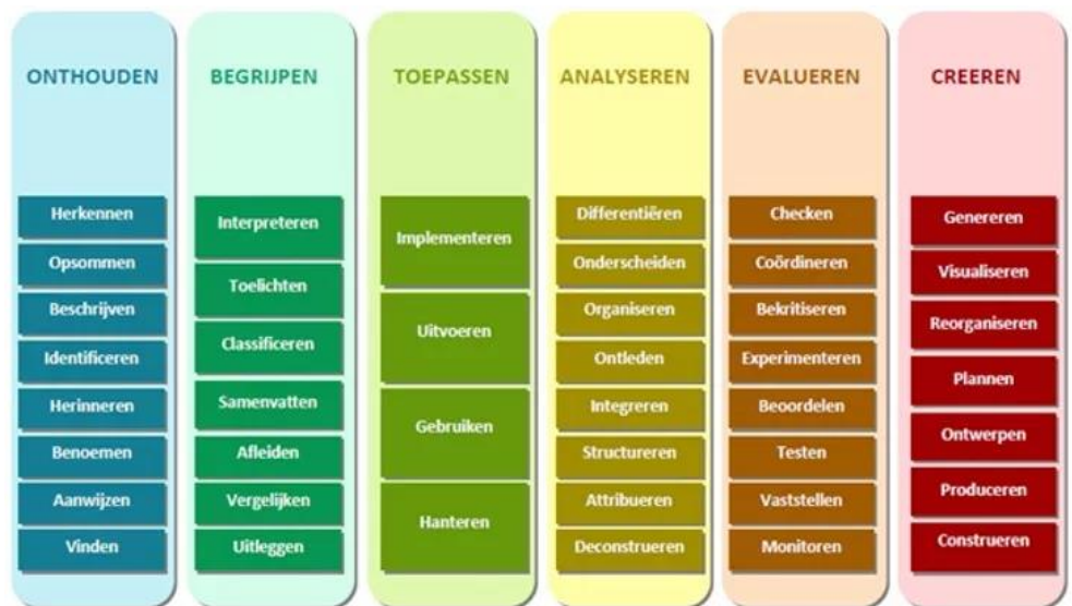
Figuur 1. Verschillende kennisniveaus van Bloom's taxonomie

Vanuit het hoofddoel zijn leerdoelen geformuleerd. Elke module heeft een aantal leerdoelen die gerelateerd zijn aan het thema van de module. Voor de formulering van de leerdoelen is de taxonomie van Bloom 1 toegepast. Bloom (1956) onderscheidt zes denkniveaus (namelijk 'onthouden', 'begrijpen', 'toepassen', 'analyseren', 'evalueren' en 'creëren')